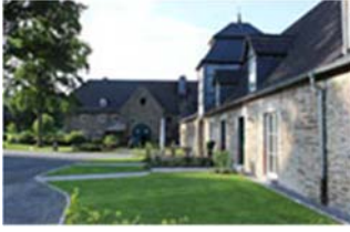
Ferien oder ein langes Wochenende auf Gut Wenne im Sauerland

Auf Gut Wenne im Sauerland finden Sie einen Ort, der Ihnen echte Wohlfühlatmosphäre vermittelt. Im historischen Ambiente der Gutsanlage bietet Ihnen unser Neffe Markus und seine Frau Ines von Weichs zur Wenne in den Wirtschaftsgebäuden zwei ruhig gelegenen, 2015 frisch hergerichtete Ferienwohnungen an: „Das Brunnenhaus“, das im südlichen Teil des Gebäudes liegt und Platz für bis zu 8 Personen bietet. Sowie „das Torhaus“, das sich mit seinem Fachwerkstil von der Gutsanlage markant abhebt und bis zu 5 Personen Platz bietet. Beide Wohnungen können verbunden werden und eignen sich dann für Gruppen oder Familien mit bis zu 13 Personen. Weitere Infos, Kontaktdaten und Anmelde-möglichkeit siehe http://www.gut-wenne.de