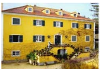
Ferien in Portugal

Das Anwesen Quinta de Sant'Ana liegt in Gradil bei Malveira, im Herzen der Estremadura. Ein historischer Familienbesitz, welcher eigenen Wein sowie Honig, Obst, Gemüse und Holz produziert. Einige der Gebäude sind zu bezaubernden kleinen Ferienhäusern umgebaut und beherbergen Gäste. Wer in kleinem oder größeren Rahmen ein Fest feiern möchte, kann auf der Quinta de Sant'Ana seinen Traum verwirklichen. Es liegt 30 km nördlich von Lissabon und ist vom Lissabonner Flughafen bequem in einer halben Stunde zu erreichen. Mehr Infos und Anmeldung unter: www.quintadesantana.com