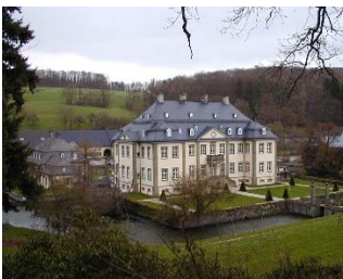
Feiern in Körtlinghausen

Nicht um dort Ferien zu machen, aber zum Feiern von Hochzeiten, Geburtstagen und anderen Jubiläen können wir folgendes Domizil sehr empfehlen: Schloss Körtlinghausen liegt prachtvoll eingebettet im Glennetal zwischen Rüthen und Warstein im Kreis Soest/NRW. Um 1740 angelegt, besteht das Barock-Ensemble aus Schlosshof mit Springbrunnen und privat genutzten Kavalieregebäuden. In den nördlichen Vorgebäuden befinden sich die Verwaltung und die Landwirtschaft. Das Schloss wird als Eventlocation für festliche Veranstaltungen und Tagungen und als Filmlocation vermietet. Siehe mehr Infos bei: https://www.koertlinghausen.de/