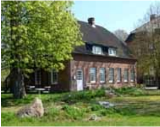
Ferien auf Gut Priesholz