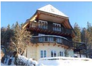
Ferien in Hinterzarten

Sie lieben die Ruhe, die Natur, Wiesen, Wind und das Meer, dann genießen Sie Ihren Urlaub auf Gut Priesholz unweit der Ostsee, bei Gelting/Kappeln, südöstlich von Flensburg. Verwandte Freunde von uns haben in den neben dem Gutshaus gelegenen Gebäuden wunderschöne Ferienwohnungen eingerichtet. Die idyllische Alleinlage des Gutshofs bietet Erholung pur, ob gemütlich allein oder mit Kindern. Die unberührte Natur- und Küstenlandschaft der Region Angeln bietet ländlich geprägte Dörfer, eine hervorragende Wasserqualität und zahlreiche naturbelassene Badestrände. Weiter Infos und Anmeldung unter: http://www.gut-priesholz.de