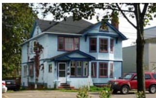
Ferien-Appartements in Charlottetown, PEI